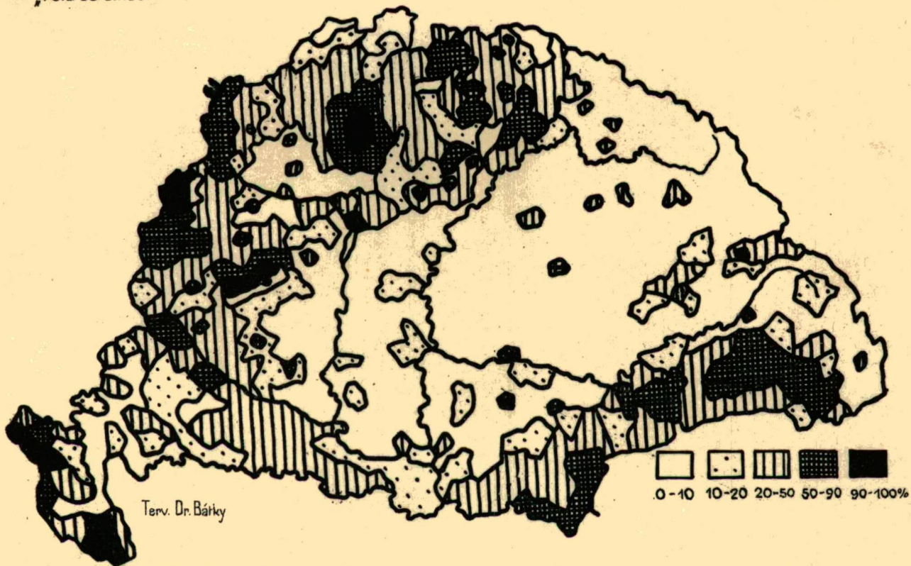
KŐ- ÉS TÉGLAHÁZAK ELTERJEDÉSE MAGYARORSZÁGON