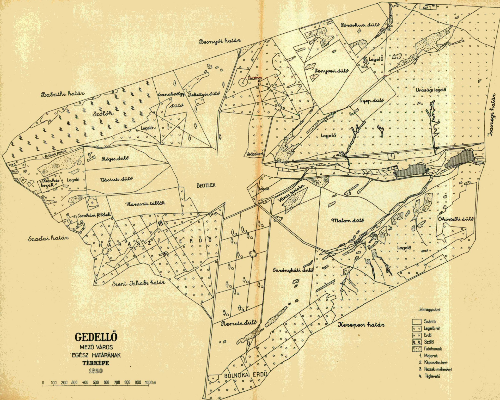
GEDELLŐ MEZŐ VÁROS EGÉSZ HATÁRÁNAK TÉRKEPE 1850

0 100 200 300 400 500 600 700 800 900 1000 m