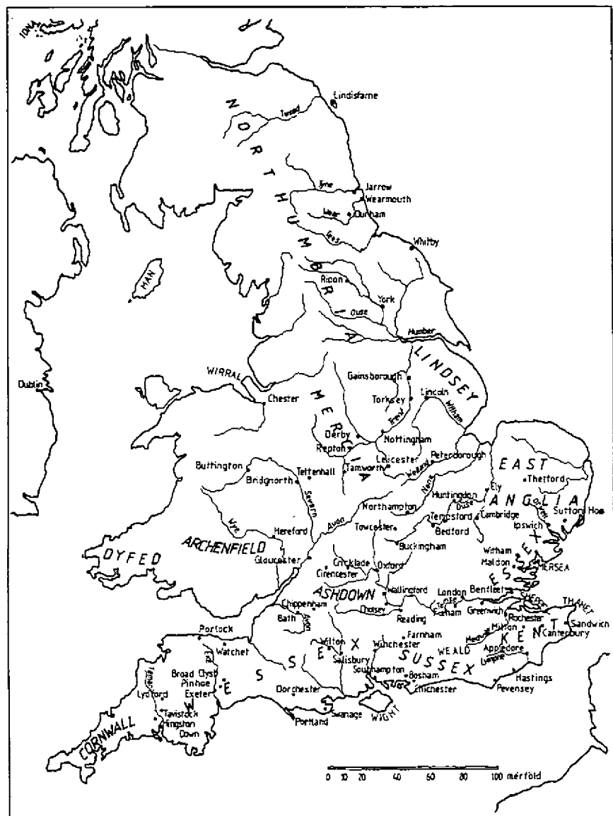
Anglia a 8-11. században