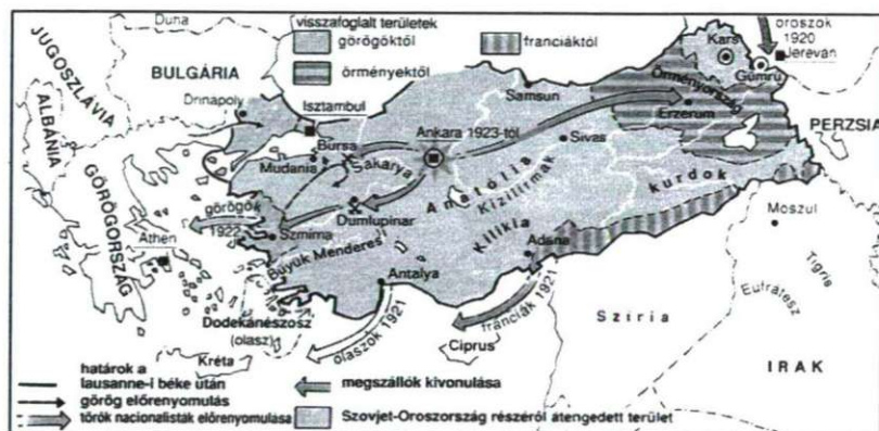
Török–görög háború 1920–1922

In: Világtörténet. Springer Kiadó, Budapest, 1992, 444. o.