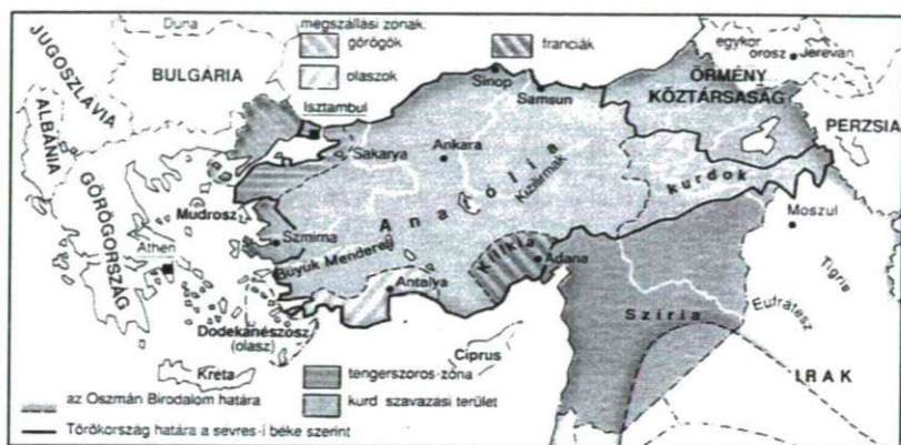
Törökország a Sèvres-i békeszerződés (1920) után