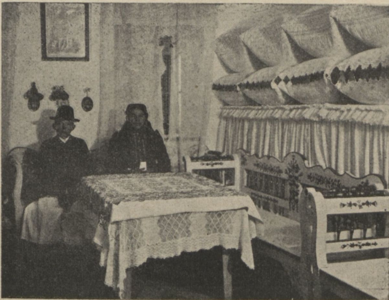
Apátfalvi szoba.

Amint ebből a leírásból látható a nagykúnsági (s vele együtt a többi vidék) magyar parasztszobája nem mérközhetik a nyugati országok parasztságának hajlékával sem dísz, sem kényelem dolgában. A legfeltünőbb különbség e tekintetben a földes padló és a többnyire