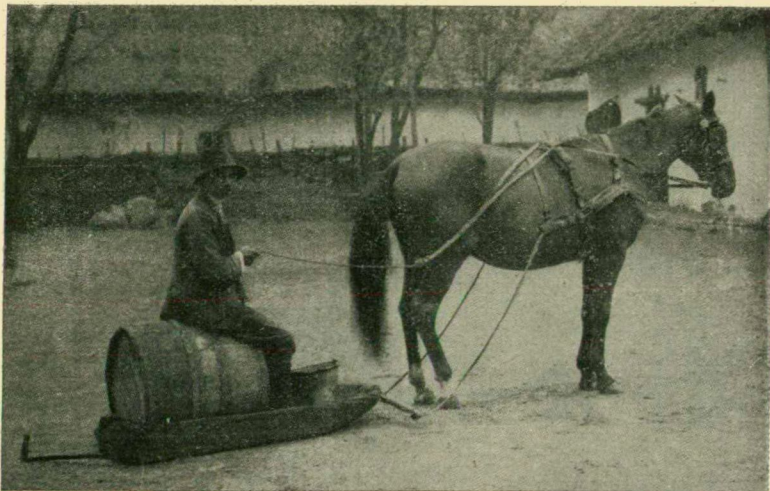
2. ábra. Lóval huzatott vontató.

Ha már nem is ezt a primitív ősalakot, de mindenesetre nagyon kezdetleges szállítókésztséget találunk még elvéve Alföldünk mocsaras vidékein a hajtószerű vontató alakjában . Néhány évtizeddel ezelőtt még általánosan elterjedt szállítókésztség volt ez a kiöntések idején a Tisza mentén és a dunamenti Sárközben, ahol a községek utcáinak sarában, semmi más járművel nem lehetett közlekedni s minthogy a lápok a belvizek lecsapolásáig ilyen állapotban voltak, joggal feltehetjük, hogy, mióta ember él ezen a területen, használja a mai vontatót.