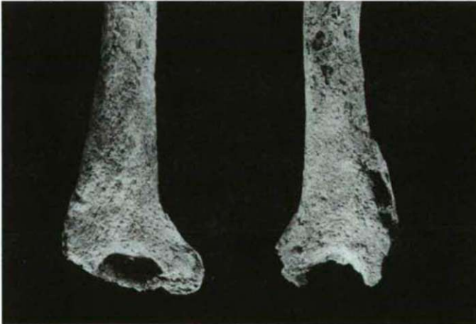
Fig. 5: Signes d'une ostéite évoluée au niveau de la partie distale des humérus. (Pignans; tombe No 29, sujet adulte mature masculin)

L'interprétation des cas d'atteinte de périostite est un domaine problématique de la paléopathologie. L'hyperossification périostée est une des modalités réactionnelles de l'os à une agression traumatique, microbienne ou autre (MAFART, 1979; DASTUGUE et GERVAIS, 1992). Une périostite tibiale localisée pourrait évoquer un syndrome de