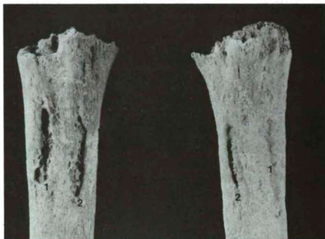
Fig. 2: Insertion des muscles grand pectoral (1) et grand rond (2) sous la forme de fosses sur les deux humérus. On note la prédominance de droite des altérations. (Pignans; tombe No 26, sujet adulte mature masculin)

sur l'humérus droit en particulier, dans cette hypothèse suggère le diagnostic de géodes osseuses dystrophiques poly-microtraumatiques par arrachement, observées en clinique dans d'autres localisations (HUSSON et al., 1991).