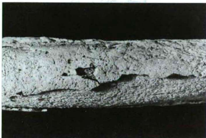
Fig. 3: Périostose évoluée au niveau du fémur gauche. La couche de la néoformation osseuse est séparée de l'os compact. (Pignans; tombe No 29, sujet adulte mature masculin)

Des lésions d'origine traumatique plus intéressantes se manifestent en plusieurs localisations. Une fracture consolidée de la clavicule droite peut être relevée. La fracture (ou une infection) a provoqué la production d'exostoses importantes au niveau de la face inférieure de la clavicule, au bord de la gouttière du sous-clavier, délimités par le tubercule conoïde et le trou nourricier. Dimensions : 22x6x8 mm et 35x9x17 mm. Les exostoses correspondent probablement à l'ossification de l'insertion de l'aponévrose clavi-coraco-axillaire (plus exactement la gaine du sous-clavier) aux lèvres de la gouttière. Dans les fractures de la clavicule, ce muscle joue un rôle important, car c'est lui qui produit le mouvement de bascule en bas du fragment claviculaire externe (PATURET, 1951). Une exostose importante de dimensions 34x11x15 mm, est visible sur l'humérus droit, juste au dessus de la dépression sous-delhoïde, en face du trou nourricier. Elle correspond vraisemblablement à l'insertion du muscle deltoïdien. Une fracture diaphysaire consolidée de l'humérus droit est probable.