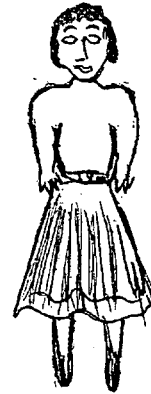
En 12 éves