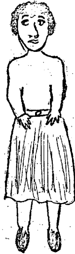
Anya 31 éves