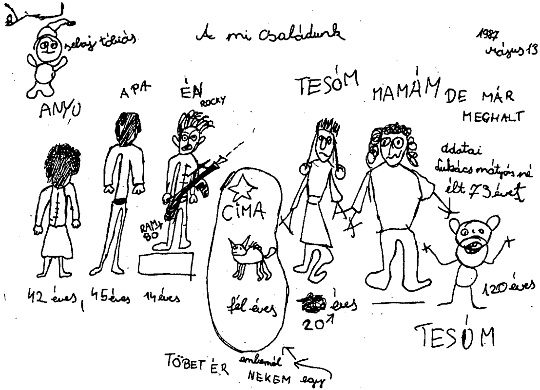
2. ábra: L.S. V. o. tanuló rajza