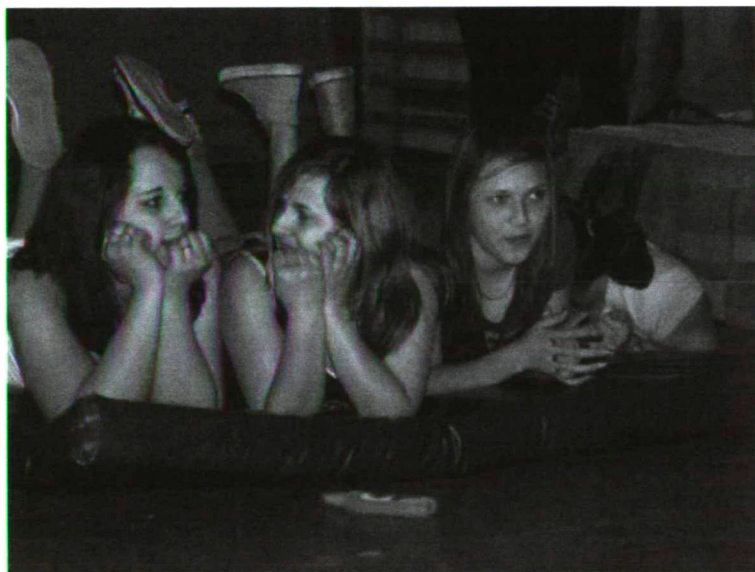
Les rites de passage – Az átmenet rítusai. 2009. április 8.