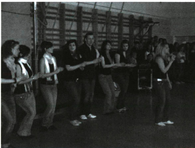
Táncos produkció ismert slágerekre. 2009. április 8.