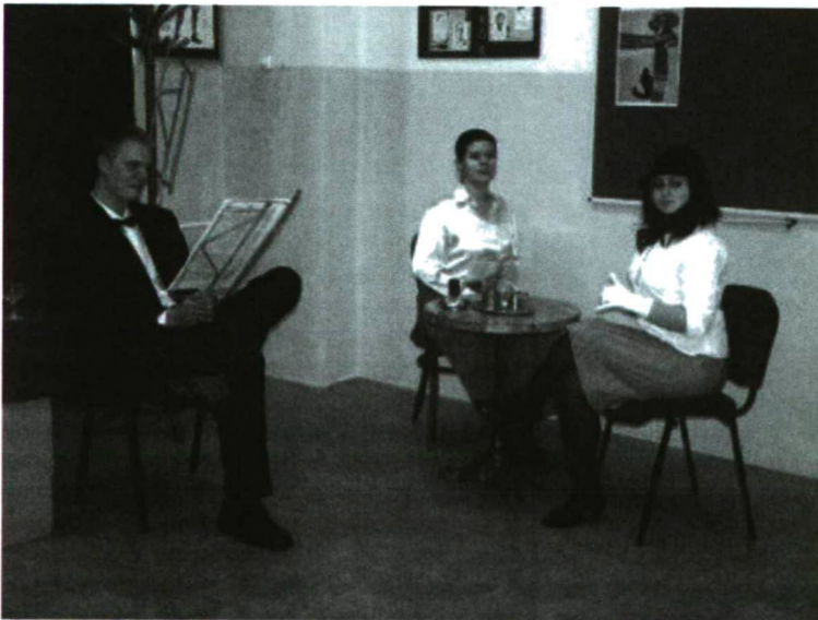
Karinthy Frigyes: Két nő beszélget. 2009. április 8.