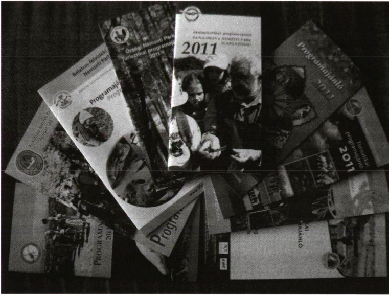
3. ábra. A nemzeti parkok programfüzetei Figure 3. Program brochures of the national parks

típusára is utalnak: gyalogos túrák zölddel, szakkörök, táborok, jelvénygyűjtő túrák gyerekeknek narancsszínnel, előadások citromsárgával, kenutúrák kékkel, kiemelt események barnával jelöltek.