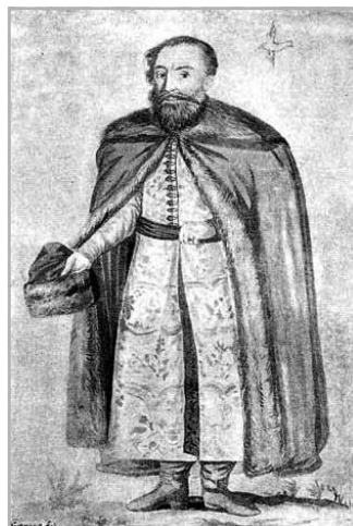
Weiss Mihály, a nagy formátumú brassói főbíró ❖ A kép forrása: Mika Sándor Weiss Mihály (1569–1612). Egy szász államférfiu a XVII. századból

Szükség is volt a szövetségesekre, mert a brassói városvezetést megosztó ellentétek országos problémákkal fonódtak össze. Báthory Gábor fejedelem 1611 decemberében elfoglalta az uralma elleni szervezkedés egyik tűzfészkeként tartott Szebent, az erdélyi szász universitas székhelyét. A szász metropoliszként is emlegetett, addig „kivülálló” számára gyakorlatilag érinthetetlen, gazdag és erős várost fejedelmi székhellyé tette, a szászok évszázados privilégiumait pedig hatályon kívül helyezte. Az erdélyi szászország történetében páratlan jogtiprás a Habsburgok erdélyi országgyesítő terveivel összefonódva szabályos polgárháborút váltott ki Erdélyben. Ez az Oszmán és a Habsburg Birodalom között öröklődő Erdélyi Fejedelemség integritását kockáztatta, 1613 őszén pedig Báthory Gábor bukásához vezetett. A harcokban kiemelkedő szerep jutott Brassónak, ami a fejedelem által kiiktatott Szeben szerepét átvéve a szász universitas vezetését vállalta magára, egyben menedéket és támogatást biztosított a Báthory hatalmával szembehelyezkedőknek. A „lázadók” célja Báthory