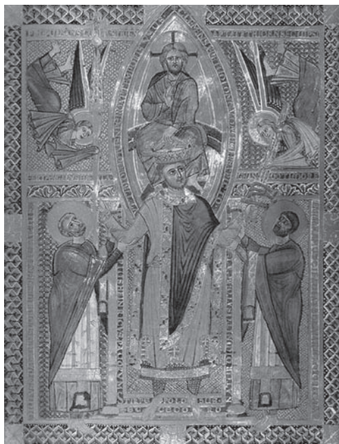
II. Henrik király a Regensburgi Sacramentariumban, 11. század ❖ http://upload.wikimedia.org/wikipedia/commons/a/aa/Kronung_Heinrich_II.jpg

veszni. Én, aki magamban gyalázatos és rossz lennék, Isten ajándéka által jó akarok lenni. Imádkozásként mondom: A mindenható és kegyes Isten javítson meg engem, régi bűnöst és tegyen titeket napról napra jobb királlyá, akiben a jó tett sohasem hal meg. Ha valaki mégis azt mondaná, hogy mivel ennek az úrnak hűséget és nagyobb barátságot vinnék, ez az igazság. Bizonyosan, úgy kedvelem őt, mint a lelkemet, sőt az életemnél is jobban. 28 De Isten az én nyilvános tanúm, aki előtt semmi nem marad ismeretlen, hogy nem a ti kedvetek ellenére kedvelem őt, mert amennyire csak tudom, őt ti hozzátok akarom (meg)téríteni. Azért, hogy azután a királyi kegy engedélyével így lehessen szólni: vajon jó-e a kereszténységet követni és szövetségben élni a pogány néppel?