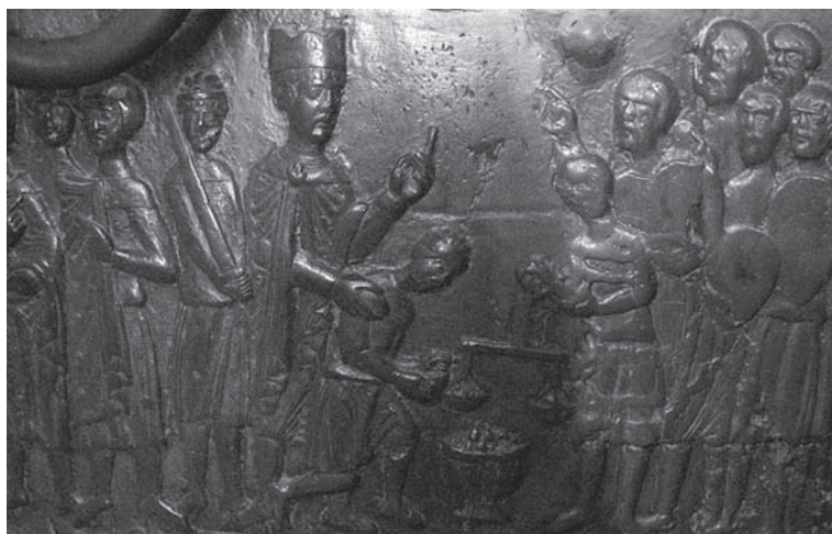
Vitéz Boleszláv a gnieznoi székesegyház kapuján ❖ http://upload.wikimedia.org/wikipedia/commons/6/6c/Drzwi_gnieznienskie_wykupienie_zwlok_Wojciecha.jpg

Péter, akinek adófizetőjeként vallja magát 38 , és Szent Adalbert mártír 39 őt nem védtek meg? Ha nem akarna segíteni az őt megölt, szent mártír, 40 akik vérüket ontották és istenfélelem által sok csodát tettek, semmiképpen sem nyugodnának megölve a saját földjükben. Én Uram! Nem vagy szelíd király, ami ártalmas, hanem igazságos és szigorú irányító vagy, ami tetsző. Ha azt hozzáteszem, hogy még legyél irgalmas és nem mindenkor hatalommal, hanem a könyörületességgel, akkor nyerd meg magadnak a népet és tedd a magad számára elfogadhatóvá. Belátnád, hogy inkább jótéteménnyel mintsem háborúval lehet megszerezni a népet és te, aki most három oldalon, akkor pedig egyiken sem viselnél háborút. De ez minket érint? Lássá be ezt az ő bölcsességében, az igazságban és jószágban szilárd király és lássák a tanácsadásban bármely püspök, gróf és herceg. Ami énrám, mi több az Isten ügyére tartozik, két dolgot mondanék, azokhoz többet nem fűzök hozzá. Két fő gonoszt kell kezdeni érezni, ahogy az Istennek és a nyers pogányság ellen harcoló