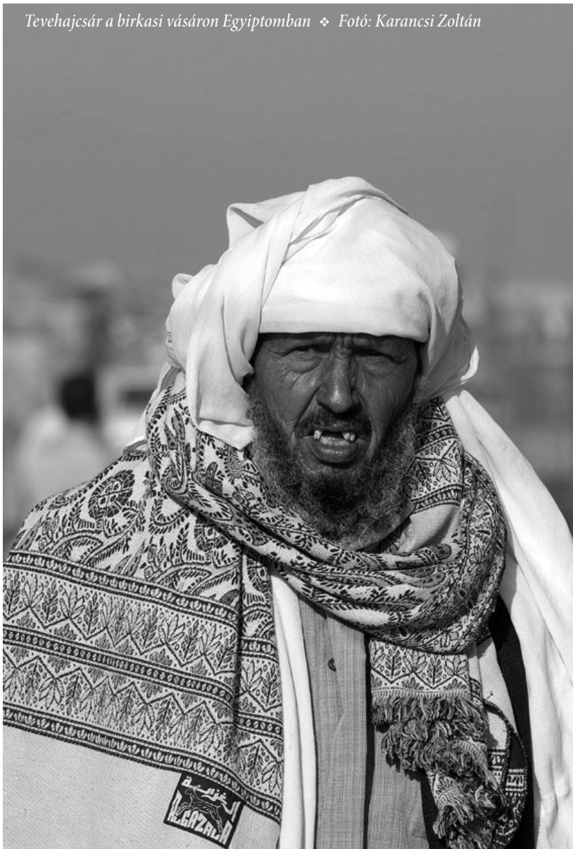
Tevehajcsár a birkesi vásáron Egyiptomban

A világháború előestéjén teljes mértékben érvényesül a francia hegemonia a Maghreb országokban. *