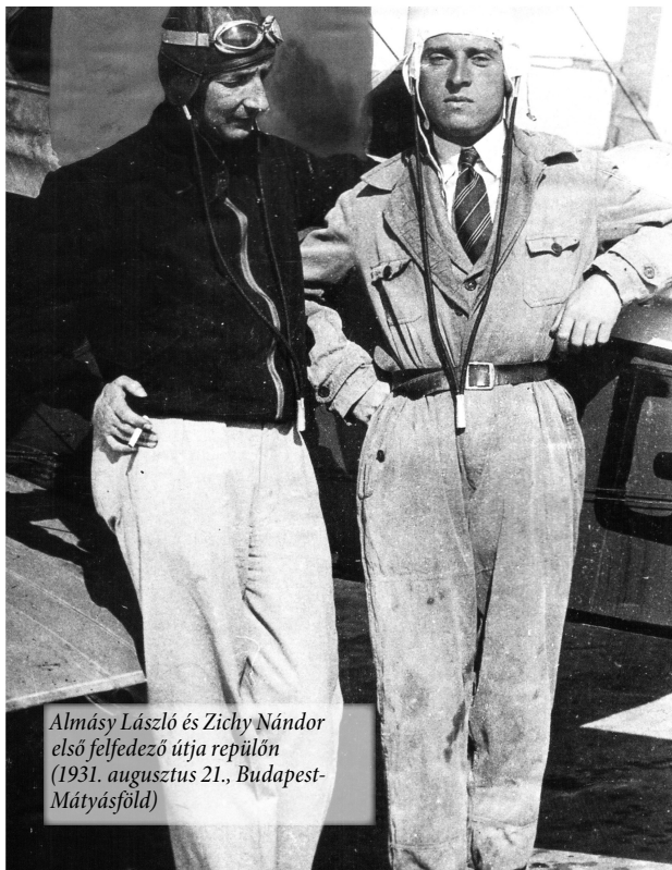
Almásy László és Zichy Nándor első felfedező útja repülön (1931. augusztus 21., Budapest- Mátyásföld)

Almásy László Ede (1895–1951) az utolsó magyar földrajzi felfedezőként a Líbiai-sivatag még addig ismeretlen területeit tárta fel a XX. század első felében. Expedícióihoz a technika modern vívmányait használta: a gépkocsi és a repülőgép segítette munkáját. Eredményeit számos kötetben és cikkben publikálta Magyarországon és külföldön.