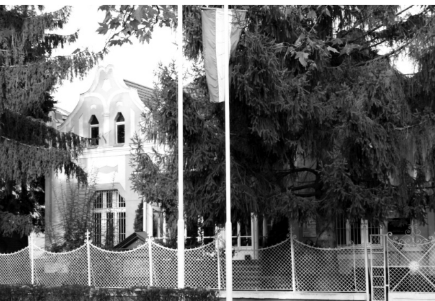
A nagyatádi Városi Múzeum

adományozták, a családi emlékezetet – fizikai és szimbolikus értelemben egyaránt – egy másik térbe, az emlékezet egy másik szintjére, a kulturális emlékezetet megtestesítő múzeum terébe mintegy kihelyezték. Ezért a Veress Péter által megkonstruált élettörténet, a múzeumi kiadványként megjelent napló és az emlékezet összefüggéseinek feltárásában kulcsfontosságú momentum a család és a múzeum kapcsolatának a története, annak – legalább vázlatos – megismerése.