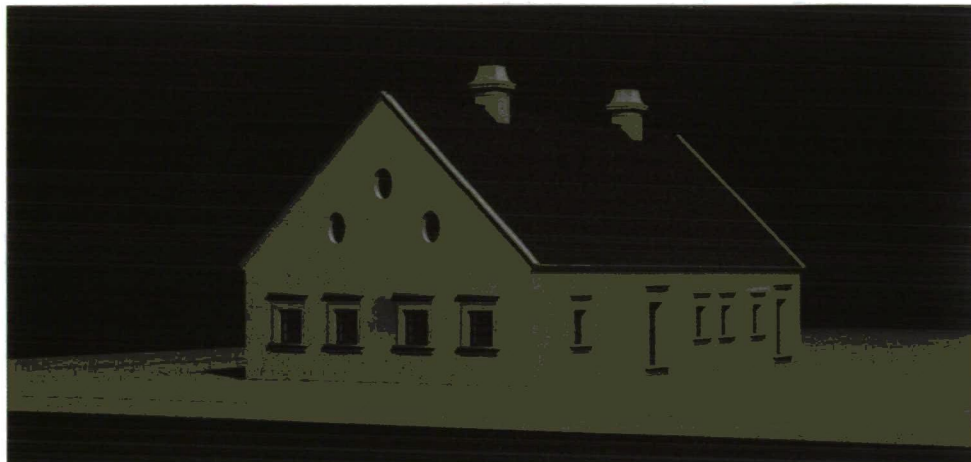
A számtartói ház 1813 körül (rekonstrukció) Gödöllői Városi Múzeum. Készítette: Szóke Balázs

belsőben elől két nagyméretű szoba volt, közülük a déli a hivatali fogadó lehetett. Mögöttük párban előszoba és egy kisebb szoba helyezkedett el. A helyiségcsoport három kályháját az előszobából fűtötték, és közös kéménybe vonták össze. Ezek mögött szintén két nagyméretű szoba, a hátsó traktusban pedig szabadkéményes konyha és kamra épült. A hátsó szobák kályháit a konyhából fűthették. Az épület alaprajza és felépítése a kor színvonalához mérve is előkelő lakáskörülményeket biztosított a hivatal és a hivatalnok lakása számára. A 19. század közepén L alakúvá bővített és historizáló elemekkel felújított épületet az erdészeti hivatal használta a két világháború között, majd a városi tanács számára a többi, egykor uradalmi épületből összevont községháza része lett. Az új városháza építése után, az 1980-as években bontották le.