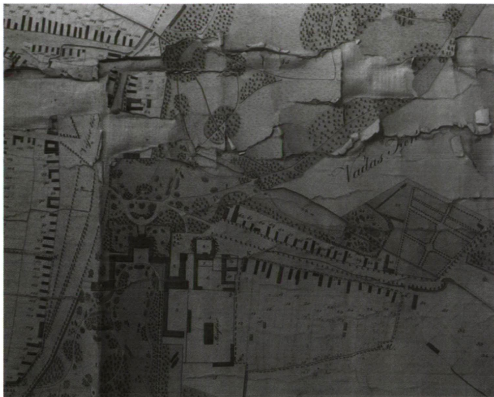
Somody Károly: Gödöllő mezőváros belső telkeinek térképe, 1843. (részlet) Pest Megyei Levéltár, PMU. 43.

A kasznár feladatköre a szemes terményekkel kapcsolatos tevékenységekre terjedt ki, lakóhelye így a magtár és a cséplőudvar környékén kereshető. 13 Az uradalmakban, így a Grassalkovichok gödöllői kastélya mellett is a domíniumot irányító tisztek lakóházai és hivatali szobái egy fedél alatt, a szolgálatra kapott ingatlanban helyezkedtek el. 14 A házak és funkciók összekapcsolódása miatt tisztségváltáskor a lakók cserélődtek. Így történhetett ez a Török család esetében is, amikor az édesapa magasabb pozícióba lépett. 15 A kasznári házat Grassalkovich I. Antal, a domínium első birtokosa emeltette az uradalom összes jelentős épületével együtt, hiszen egy egyszerű kuriális faluból birtokainak központját kellett kialakítania, annak minden tartozékával együtt. Az építető gróf által készített épületjegyzék a gödöllői birtoktest esetében a hozzávetőleges építési költségeket is feltüntette. A frumen-