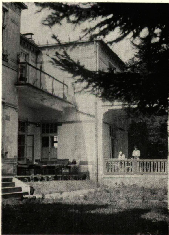
Tüdőbetegosztály Kolozsvárt. — Abteilung für Lungenkranke in Kolozsvár.