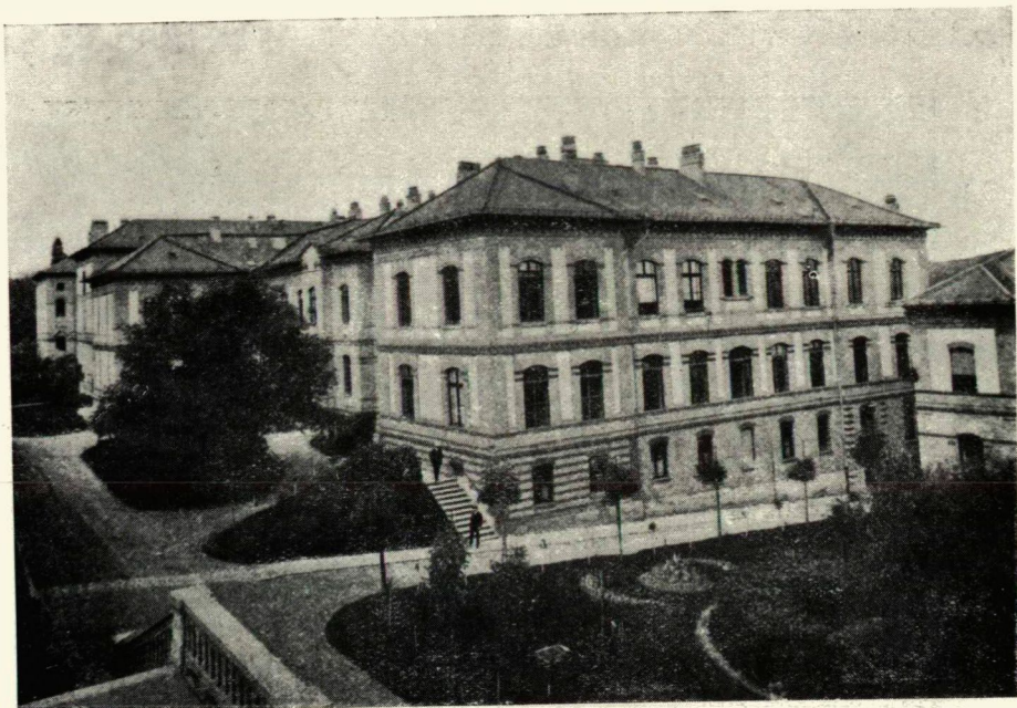
A belgyógyászati klinika új épülete Kolozsvárt. — Das neue Gebäude der med. Klinik in Kolozsvár.