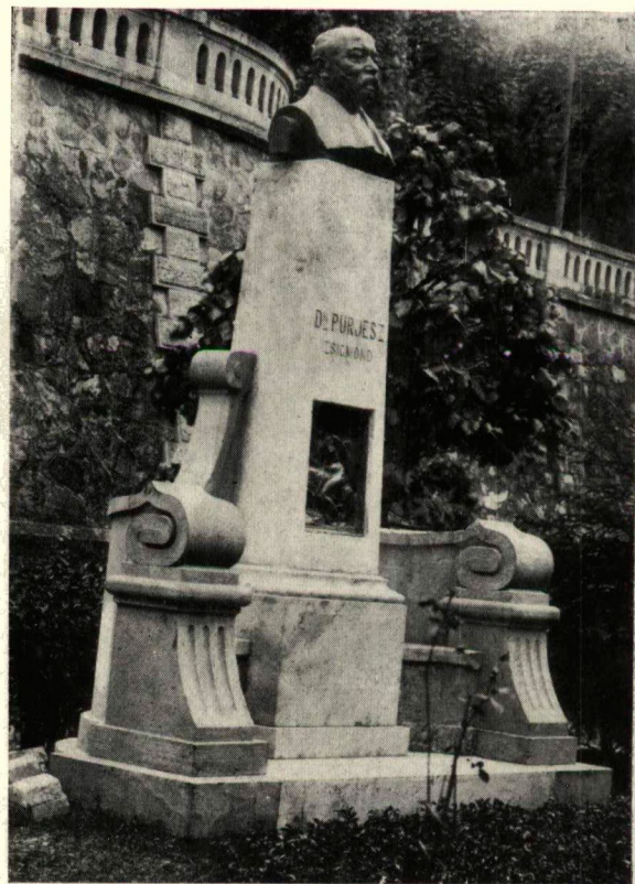
PURJESZ-emlékmű a belgyógyászati klinika előtt. PURJESZ Denkmal vor der med. Klinik.