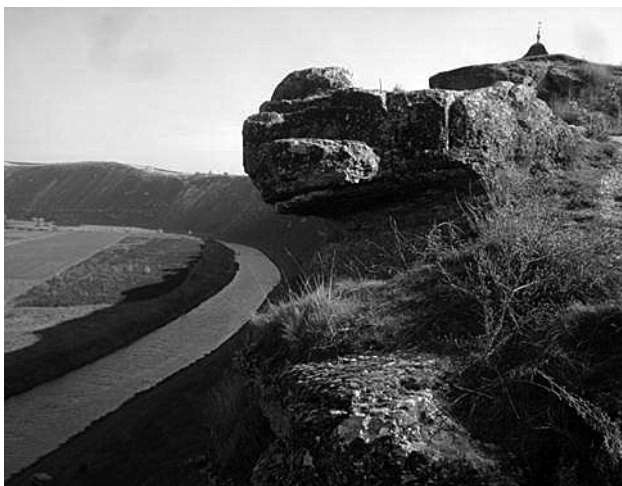
A Ráut kanyon sziklái