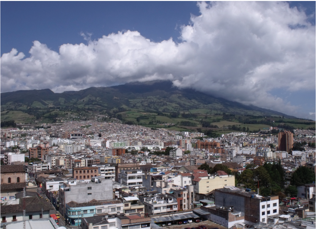
FOTO Ciudad de San Juan de Pasto, Colombia ❖ La foto fue tomada por Gábor Molnár en 2011.

En Nariño el bambuco es realmente escaso. La compilación regional más antigua de la cual hay noticia, realizada por Nemesiano Rincón 5 , muestra esta situación: de un total de 145 obras sólo se encuentran dos bambucos, las restantes, 143, están repartidas entre pasillos, danzas, valeses, himnos, marchas, one steps , polcas, fox-trots , pasodobles, mazurcas, himnos y tangos, siendo, los tres primeros, los más abundantes. Esta circunstancia puede tener explicación en el hecho de que las obras publicadas pertenecían, salvo contadas excepciones, a una élite social de la ciudad de Pasto (I. Foto) que no admitía a los miembros de las clases populares, donde pudo tener mayor asiento el bambuco, transmitido por tradición oral e interpretado sin la mediación de la escritura musical. Estas condiciones de marginalidad le negaban el acceso a los círculos de la alcurnia regional. La excepción a la que se hace referencia la constituyó Luís E. Nieto 6 (1899–1968), aceptado por las élites pastusas porque era reconocido como un notable compositor desde Quito hasta Bogotá. Nieto era un músico de profundo arraigo popular y sin formación académica como muchos de los intérpretes y compositores de las clases de escasos recursos. El contacto permanente con la gente de a pie , con músicos serenateros y agrupaciones campesinas, abonó el terreno para inspirarle los pocos, pero bien sentidos, bambucos. Los ejemplos incluidos en la compilación de N. Rincón son suyos: Ñapanguita soy y ¿Qué saco con ella?