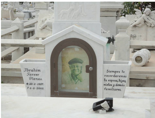
FOTO La tumba de Ibrahim Ferrer, el famoso miembro de la banda cubana Buena Vista Social Club