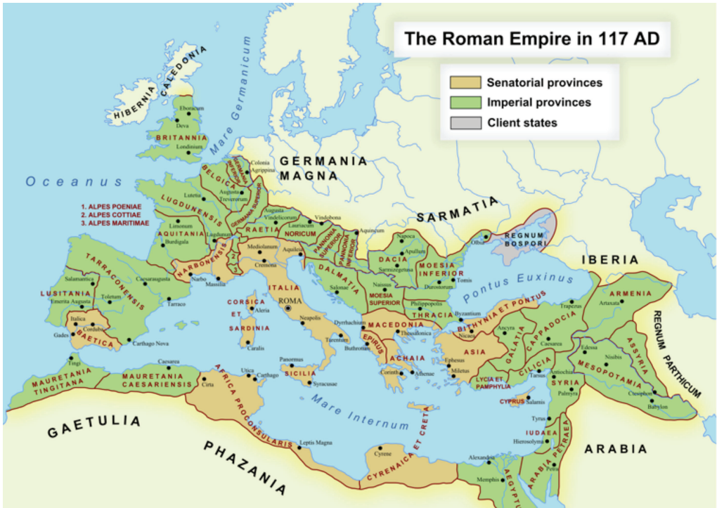
1. ÁBRA ❖ A Római Birodalom a Kr. u. 2. században. Elérhető: http://www.ancient.eu/image/266/ Hozzáférés: 2015.08.21. 11:40.

keny volt, hiszen például ha egy szolgálónének szabadtól született gyereke, akkor azok nem voltak elidegeníthetőek a tulajdonostól, és a két réteg közötti ilyen jellegű kapcsolat már az ókorban is elterjedt volt. 39