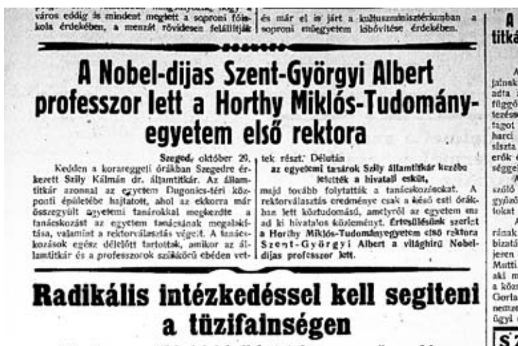
1. kép. A Szegedi Új Nemzedék híradása a rektorválasztásról (1940. 10. 30.).

mentumokat, a korabeli sajtó vonatkozó cikkeit, és a szereplők visszaemlékezéseit. Mindezek alapján azt mondhatjuk tehát tárgyunk értékeléseként, hogy a vizsgált időszakban, Szent-Györgyi Albert rektorsága alatt, az 1940/41-es tanévben az egyetemen létező felsőoktatási autonóm légkör eredményeként egy olyan hallgatói demokrácia-kísérlet született meg, amely az egyetemi polgároknak a campus-lét megélését sajátos, szabad lelkületű egyetemi hallgatói öntevékenységben kicsúcsosodva azt eredményezte, hogy az egyetemi ifjúság világa a perifériáról a gondolkodásnak a centrumába kerülhetett. Mindez köszönhető volt a reneszánsz embernek, a Nobel-díjas tudósnak és az aktív egyetemi vezetőnek, Szent-Györgyi Albertnek.