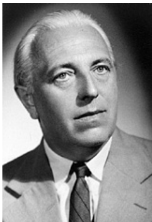
6. kép. Baróti Dezső (1911–1994) irodalomtörténész, egyetemi tanár, az egyetem rektora (1955–1957). A Szegedi Fiatalok Művészeti Kollégiumának (1930–1937) tagja, a Szegedi Egyetemi Ifjúság (SZEI) támogatója, mentora, később az 1956-os Magyar Egyetemisták és Főiskolások Szövetsége támogatója, mentora, az 1957. évi megtorlás áldozata.