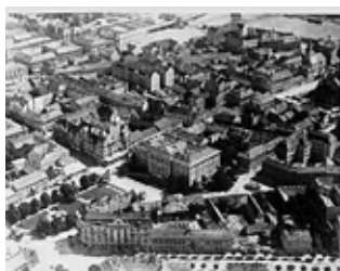
2. kép. Kószó István légifotója (1936).