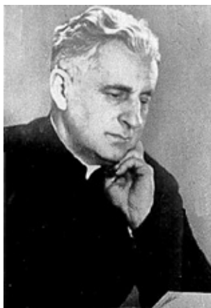
5. kép. Sík Sándor (1889–1963) piarista tartományfőnök, költő, irodalomtudós, akadémikus, egyetemi tanár. A Szegedi Fiatalok Művészeti Kollégiuma (1930–1937) és a Szegedi Egyetemi Ifjúság (SZEI) támogatója, mentora.