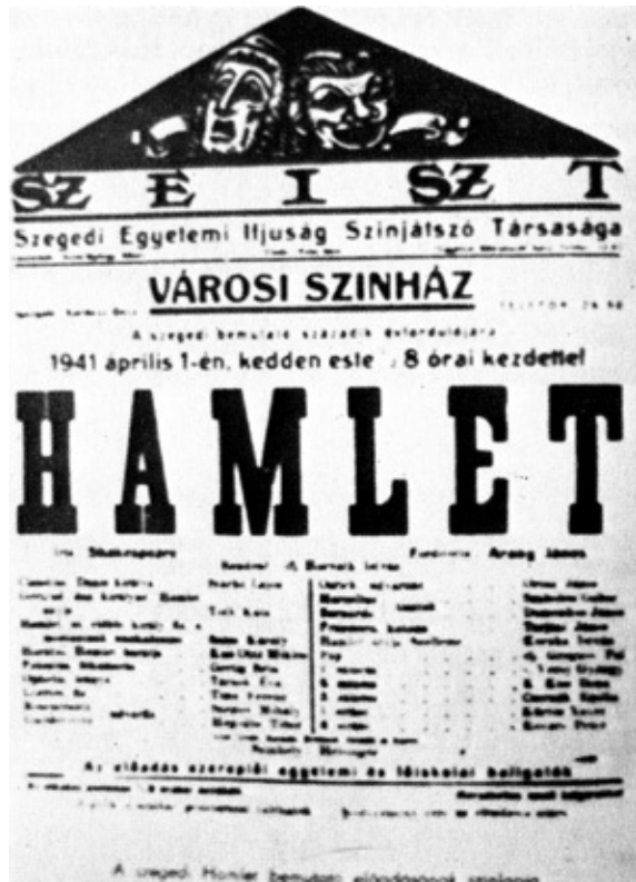
10. kép. A Hamlet szegedi előadásának plakátja.