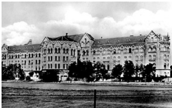
3. kép. Szent-Györgyi Albert a Szukováthy téri épület (ma Ady tér) Auditorium Maximumába hívta össze az egyetem polgárságát a SZEI megalakítására (1940. december 13.).