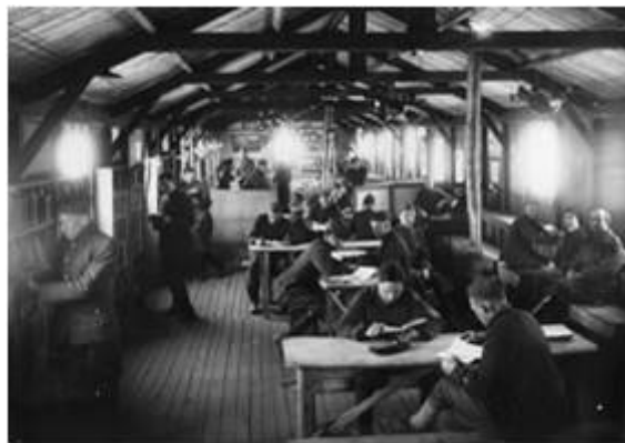
Amerikai tábori könyvtár (Camp Library) az első világháborúban