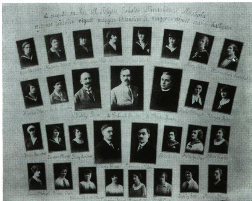
„Szeretett tanárunknak hálás szeretettel és megemlékezéssel a III. évf. hallgatói. Szeged, 1932. június 17.”

Csanád megye megszűnésével a Csanádvármegyei Könyvtár működése is véget ért. Ez azonban nem jelenthet kiesést a szellemi élet folytonosságában. Biztató ígérteit láthatjuk ennek abban is, hogy a József Attila Múzeum Értesítőjében ez a közlemény megjelenhetett.