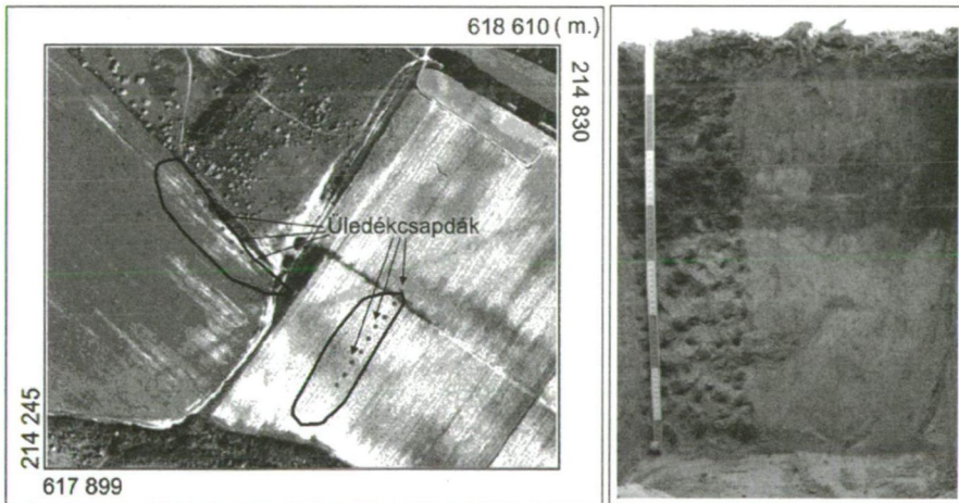
1. ábra: A részvízgyűjtők elhelyezkedése és a szántón feltárt talajszelvény

A modell kalibrációhoz szükséges üledékcsapdás mérések számára két olyan részvízgyűjtőt (1. és 2. sz.) jelöltünk ki a Cibulka-vízgyűjtőn belül, amelyek minden szempontból jól reprezentálják az egész kisvízgyűjtő tulajdonságait. Az 1. sz. terület egy szántón helyezkedik el a Cibulka-pataktól nyugatra (1. ábra).