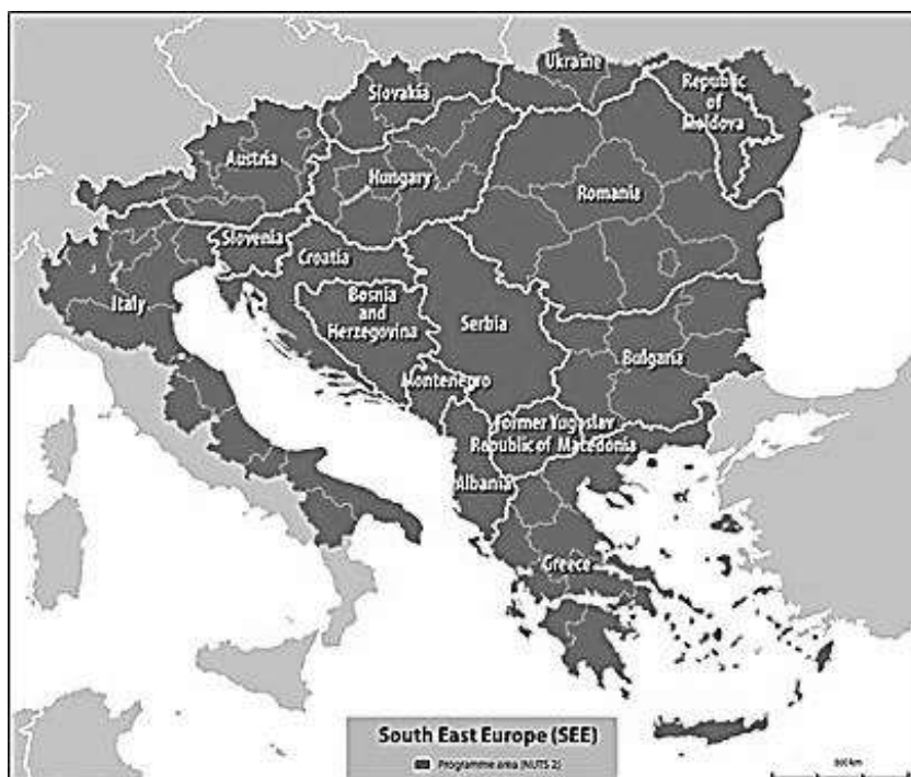
1. ábra A Délkelet-európai Transznacionális Együttműködési Program földrajzi területe

Az egyetemek és tudásparkok a főbb városi területeken és/vagy regionális gazdasági központokban koncentrálnak, így az egy lakosra jutó felsőoktatási K+F kiadások (HERD) helyzete kiválóan szemlélteti egyrészt a nyugat-, közép- és észak-európai tagállamok, másrészt a dél- és kelet-európai államok kettéosztottságát. A HERD értéke sok észak- és közép-európai tagállamban (kivéve Németország) magas (250-970 euro/lakos), míg a déli és keleti tagállamokban alacsony (0-50 euro/lakos), a fővárosok figyelemre méltó teljesítményétől eltekintve (EC 2012).