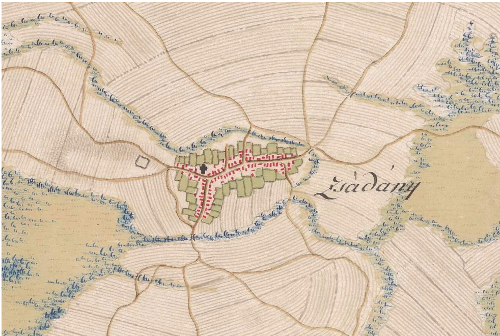
1. ábra Zsadány az I. katonai felmérés idején (1783)

Az urbáriumot végül is 1773-ban vezették be, s ezzel Zsadány is betagozódott az átlagos jobbágyfalvak közé. A kiváltságos állapot következményeként azonban az akkor 79 családból jobbágy volt 75, házas zsellér 2, házatlan zsellér pedig szintén 2. A jobbágytelkek szántóterülete összesen 382 és \frac{1}{4} holdat tett ki (Makai 1999).