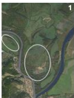
övezetny-sarlólapos rendszer (1, 2)