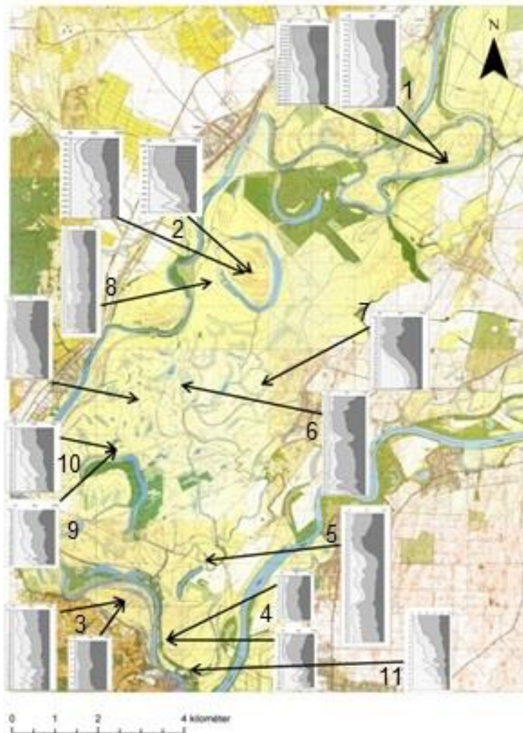
2. ábra Sekélyfűrésok szemcseösszetételi diagramjai Bodrogszág különböző formátípusairól. Övzátóny – sarlólapos rendszerek: (1: a vissi Holt-Bodrog szomszédságában, 2: a Fekete-tó mellett, 3: a Lebúj-kanyar melletti Felső-legelőn - ez a Bodrog jobboldalán van és 4: a Bodrogszág D-i csúsa közelében). Az egyes mintavételi helyek első szelvénye övzátónyt, a második sarlólapost mutat. Ártéri laposok: (5: Nagy-Tökös-tónál, 6: Fehér-tónál 7: a Zalkodi-lapály). Tagolatlan ártéri síkok: (8: Favágószállás, 9: Nagy-tó, 10: Kerek-tó, 11: Bodrogszág)

A Bodrogszágban ennek az ártéri formaegyüttesnek (1. ábra a, b) különösen fejlett, látványos példái vannak. A 2. ábra az övzátónyok és a sarlólaposok négy különböző helyzetű rendszerében (1: a vissi Holt-Bodrog szomszédságában, 2: a Fekete-tó mellett, 3: a Lebúj-kanyar melletti Felső-legelőn – ez a Bodrog jobboldalán van és 4: a Bodrogszág D-i csúsa közelében – 1. ábra 1. és 2. képe) végzett fűrésok szemcseprofilját mutatja be, amelyeket e formaegyüttes fejlődésére vonatkozó megállapításaink szemléltetésére prezentálunk.