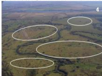
1. ábra A dolgozatban tárgyalt ártéri formacsoportok példaterületei a Bodrogzugban (Az 1, 3, 4 légifelvételek a Bükk Nemzeti Park szíveségéből, a 2. kép a (Szabó J.) 2006 márciusában készült 596 cm-es vízállásnál)