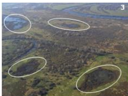
ártéri laposok (3), tagolatlan ártéri felszínek (4)