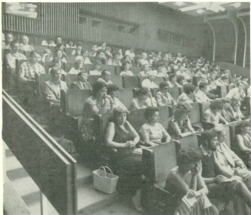
A nyári egyetem hallgatói