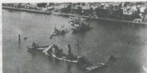
A Szuezi-csatornában elsüllyesztett 46 hajó közül néhánynak csak a kéménye emelkedett ki a vízből