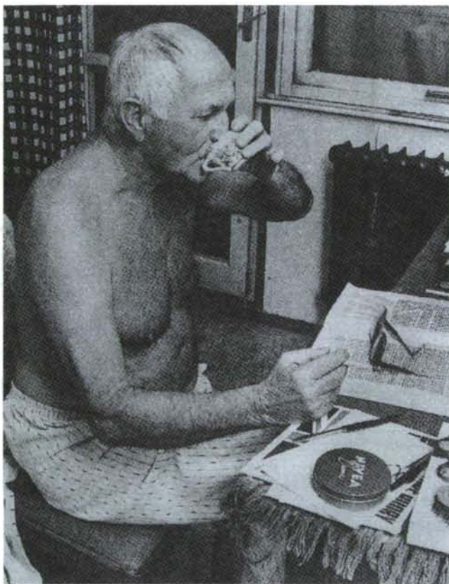
Ma remekmű születik