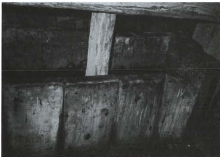
Munkában a szőlőprés