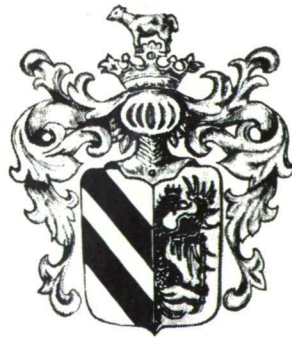
SZEGED 1921 – 1922