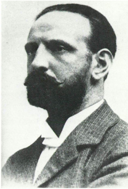
APÁTHY ISTVÁN (Pest, 1863. január 4. — Szeged, 1922. szeptember 27.)