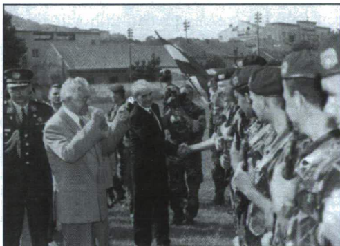
FRANJO TUĐMAN HORVÁT ELNÖK KATONAI SZEMLÉT TART...

A választások után a szlovén és a horvát vezetés elérkezettnek látta az időt, hogy kimondja – Jugoszlávián belüli – szuverenitását. A Horvátországban tartott népszavazáson (melyet a helyi szerbek bojkottáltak) a szavazók 94%-a a függetlenség mellett foglalt állást. Szlovénia és Horvátország 1991. január 20-án védelmi egyezményt kötött. Emellett Horvátországban megkezdődött a Szövetségi Kormányzattól független fegyveres erő megteremtése. Sor került a rendőrség átszervezésére és fegyverek beszerzésére is. Ekkor keveredik fegyvereladási gyanúba – amint később kiderült, jogosan – Magyarország is. ( Spegelj akkori horvát hadügyminiszter a későbbiek során beismerte, hogy Magyarország más fegyverek mellett 24 ezer Kalasnyikovot adott el Zágrábnak.) A szerbek tudomást szereztek az akcióról, ami ekkora hatalmas botrányná duzzadt. A szerb televízióban bemutatták