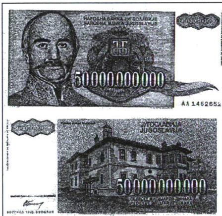
4. ábra A LEGNAGYOBB CÍMLETŰ BANKJEGY KIS-JUGOSZLÁVIÁBAN (1993-BÓL)

LAURA SILBER – ALLAN LITTLE: Jugoszlávia halála .