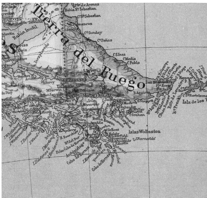
1. térkép: A Beagle-csatorna 1914-es ábrázolása

http://en.academic.ru/pictures/enwiki/77/Mapa_Canal_del_Beagle%2C_1914.jpg (Letöltés: 2014.03.19.)