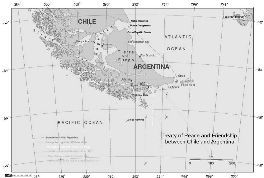
4. térkép: „Béke és Barátság Szerződés” http://upload.wikimedia.org/wikipedia/commons/c/ca/Beagle.1984.en.png (Letöltés: 2014.03.23.)