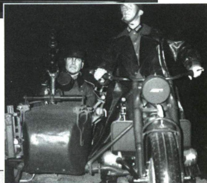
7. ábra MG-34 TÍPUSÚ GÉPPUSKÁVAL FELSZERELT NÉMET OLDALKOCSIS MOTORKERÉKPÁR ÉLETNAGYSÁGÚ MODELLJE