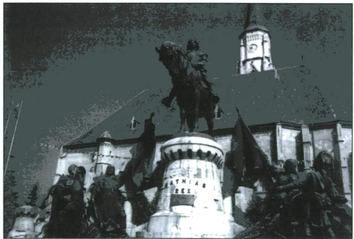
FADRUSZ JÁNOS MÁTYÁS-SZOBRA KINCSES KOLOZSVÁROTT

vonalat. 1872-ben szentesítette a király a kolozsvári egyetem felállításáról rendelkező törvényt. 1894. május 17–25. között folyt le a memorandum-per. 1902. október 12-én leplezték le Fadrusz János Mátyás király szobrát. 1918. december 24-én vonult be a román hadsereg Kolozsvárra. A trianoni békeszerződés értelmében a város Romániához tartozott. 1920-ban megindult a romániai magyarság irodalmi folyóirata, a Napke-