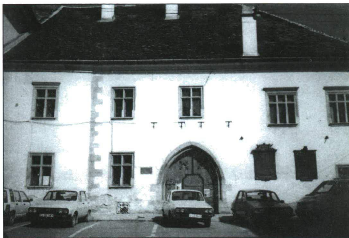
MÁTYÁS KIRÁLY SZÜLŐHÁZA ELŐTÉRBEN A KÁRPÁTOK LUXUSCRIKÁLÓI