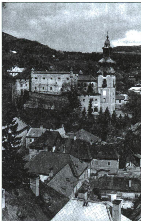
UTÁNOZHATATLAN FELVIDÉKI HANGULAT

ZÓLYOM ■ (Zvolen, Altschl): Város Besztercebányától délre, ma Szlovákiában. Szláv előzmények találhatók a város területén. A honfoglalás után a 12. században szervezték meg erdőispánságát, amelyre aztán a várat is felépítették. Ispánjait 1222-től említik. 1243-ban kelt oklevelében IV. Béla király megerősítette a zólyomi hospesek városi kiváltságait. 1250. november 11. előtt IV. Béla Zólyomban kötött szövetséget a tatárok ellen a halicsi fejedelemmel. 1310-ben Csák Máté szerezte meg a várost. Az Árpád-házi és az Anjou uralkodók kedvelt vadászterülete volt Zólyom környéke. 1364-től rendszeresen megfordult erre I. Lajos király. 1379. február 6. körül itt találkozott Vencel cseh és német királlyal, IV. Károly császár fiával. 1382. július 25-én I. Lajos ide hívta meg a lengyel főpapokat és főurakat, hogy leánya, Mária és vőlegénye, Luxemburgi Zsigmond előtt hódoljanak. 1424 és 1526 között a királynék városa volt. Vára a hódoltság korában a bányavárosokat védte, a Balassák birtokában volt: Itt született 1554. október 20-án Balassi Bálint költő. A Rákóczi-szabadságharc után az Eszterházyaké, majd a kincstáré lett. 1703. november 15-én Bercesényi Miklós gr. és Károlyi Sándor br. győzelmet arattak Forgách Simon gr. császári tábornok hadserege felett. A város fejlődése