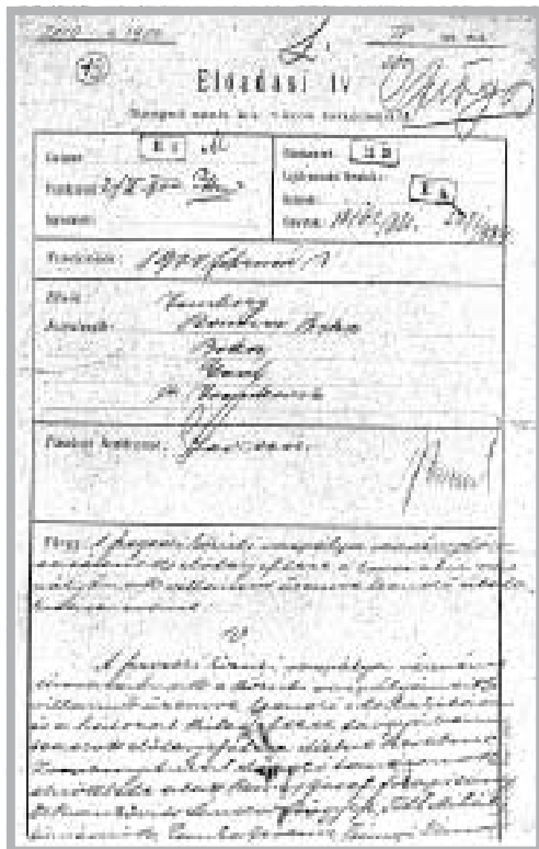
1. ÁBRA A VÁROS TANÁCSA 1900. FEBRUÁR 1-JÉN TÁRGYALTA A SZEGEDI KÖZÚTI VASÚT 1899. DECEMBER 31-ÉN KELTEZETT BEADVÁNYÁT, AMIBEN A LÓVASÚT VILLAMOS ÜZEMRE TÖRTÉNŐ ÁTÉPÍTÉSÉT KEZDEMÉNYEZTE