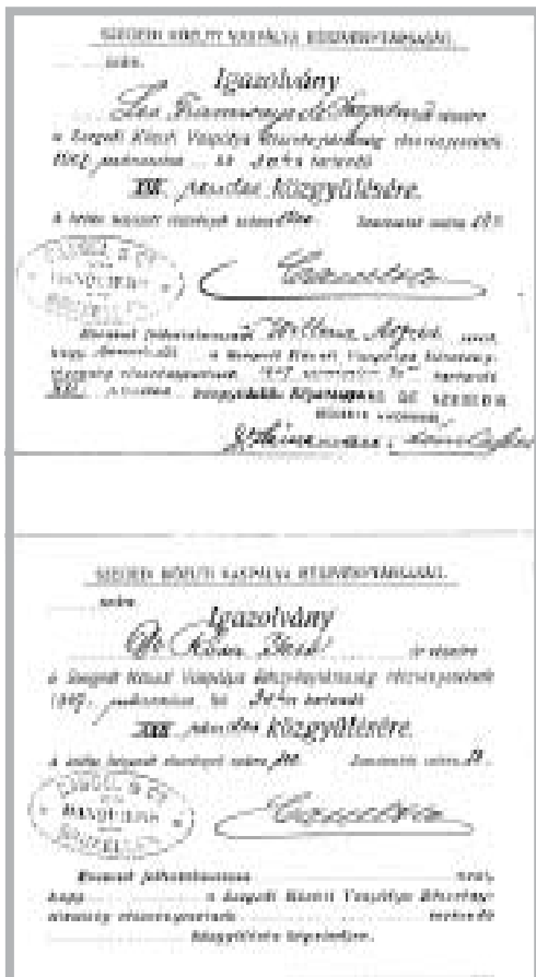
3. ÁBRA IGAZOLVÁNYOK A LETÉTBÉ HELYEZETT RÉSZVÉNYEK-RŐL

4 Szegedi Napló, 1905. április 2. A Szegedi Közúti Vaspálya Rt. 1905. március 21-én tartotta XX. közgyűlését, amin az előadó arra is kitért, hogy: „hálózatunk villamos üzemre való átalakítá-