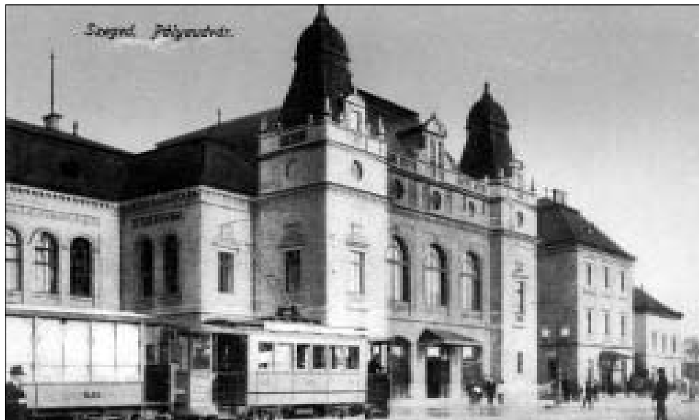
4. ÁBRA A 21-ES SZÁMÚ VILLAMOSKOCSI NYÁRI PÓTKOCSIVAL A SZEGEDI PÁLYAUDVAR ELŐTT

- szeptember 22.: „A büszke lófejű. Bekerült a Kárász utcába. Az ócska múlt és a reményteljes jövő vasárnap óta egy úton halad. A múlt: az ütött-kopott, viharedzett, sáros és poros zöld batár, a jövő: a ma még friss festésű sárga kocsi, vagy ha jobban tesszük: a lóvasút, meg a villamos. Az a csoda történt ugyanis, hogy a két vasútállomás között kiépülvén a villamos sínpár, ismét üzembe hozták a jó ideje már csak egyes szakaszokon ballagó, buttogó lófejűt. A kocsik végigmennek Szegedtől Szeged-Rókusig az egész vonalon átszállás nélkül... Mivel pedig rendőrhatalósági engedellyel a villamos is szaladgál, hogy próbameneteinek számát