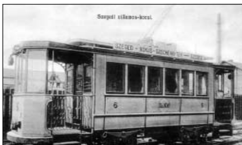
5. ÁBRA A 6-os SZÁMÚ VILLAMOSKOSCI 1925-TŐL PÓTKOSCIKÉNT KÖZLEKEDETT, 1940-BAN SELEJTEZTÉK