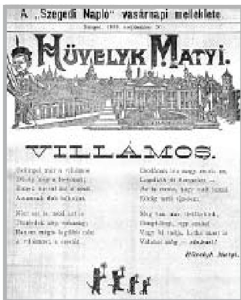
3. ÁBRA HELYZETKÉP, VAGY INKÁBB „HELYZETVERS” A VÁROSI KÖZLEKEDÉSRŐL

A munkavezeték a pálya mentén felállítandó oszlopokra szerelt egy, illetve kétkarú