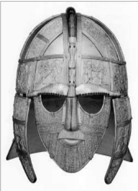
VIKING DÍZSISAK A VII. SZÁZADBÓL. A IX. SZÁZADI S KÉSŐBBI DÁN PORTYÁK BETÖRÉSEI SÚLYOS KÁROKAT OKOZTAK A SKÓT-ALFÖLDÖN

Jelenleg Skócia öt és félmillió főt kitevő lakosságának csupán egy elenyésző hányada, mintegy hetvenezer felvidéki lakos beszél kelta őseinek nyelvét, a gaelt. 3 Ez természetesen nem azt jelenti, hogy Skócia lakosságának csupán 1,2 %-a rendelkezne kelta felmenőkkel, hisz a több mint ezeréves elangolosodási folyamat eredményezte ezt a gael nyelv szempontjából oly reménytelen állapotot. Azonban az angol nyelv ilyen mértékű diadalát a modernizációt mindig követő angol kulturális hatás nem magyarázhatja meg kizárólagosan. 4 Skócia területén ősi idők óta fogva jelentős létszámú angol nyelvet beszélő lakosságnak kellett élnie ahhoz, hogy nyelvük az évszázadok folyamán az egész ország anyanyelvévé váljon. Ezt a problémakört szeretném most ezzel az írással körbejárni, hogy megvilágítsam, milyen etnikai összetevők is formálták, és alakították ki a