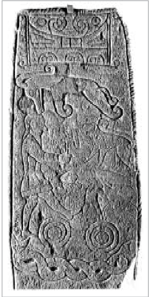
PIKT KŐLAP, ISMERETLEN JELENTÉSŰ VÉSETTEL

Végeredményben bátran állíthatjuk, hogy Skócia déli részének, az Alföldnek a lakossága döntő részben germán etnikumú vagy, hogy Andrew Lang történész sorait idézzem: „Az eredetileg ír származású skótok adták a nevét annak az országnak, amely lakosságának legnagyobb része vérségileg és nyelvileg is angol származású.” 24