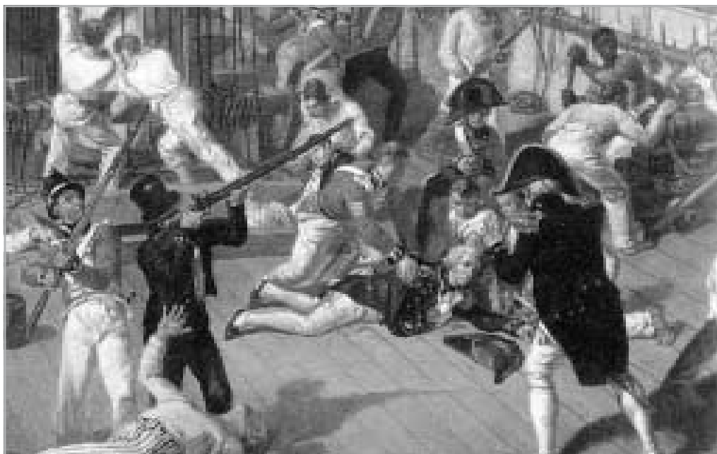
A TENGERNAGY HALÁLA: NEM ÉLTE TÚL A TRAFALGÁRNÁL ARATOTT LEGNAGYOBB GYŐZELMÉT