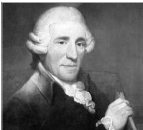
ESZTERHÁZA ZENESZERZŐ ZENIJE, JOSEPH HAYDN

A Missa in Angustiis komponálása közben értesült a legenda szerint Nelson Abu-Kir melletti diadaláról, s ettől fellelkesülve szötte bele a Benedictusba a trombitafanfárt.