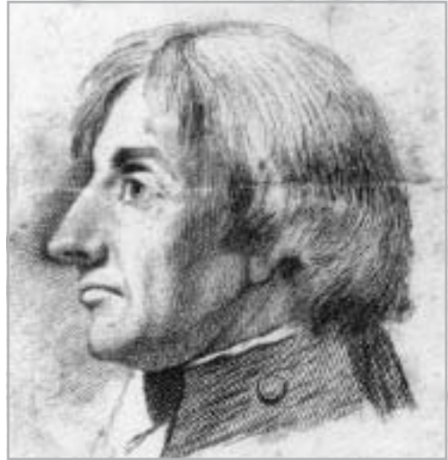
NAPOLEON EGYIK LEGNAGYOBB ELLENFELE, NELSON ADMIRÁLIS

Kettőjük szerelme és személye közkedvelt alakja volt a korabeli romantikus lelkülettől átitatott Európának. Olyanok voltak ők, mint Odüsszeusz és Calypso, Antonius és Cleopatra, Sámson és Delila. Nelson, aki 1793. január 25-én kapta meg a parancsnokságot az Agamemnon fedélzetén, június 6-án vitorlázott a Földközi-tenger vizeire és szeptember 11-én érkezett Nápolyba, ahol megismerkedik élete szerelmével, Lady Hamiltonnal. 12 Még ugyanebben az évben