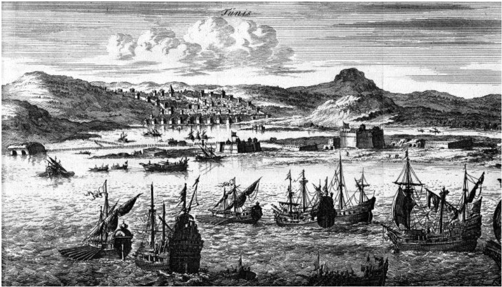
2. ÁBRA ❖ Tunisz és annak kikötővárosa, azaz La Goletta 17. században. (DAN 1684a. 164. oldalt követően; DAN 1684b)

a tárgyalásos megoldás lehetőségét, és követték azok módszereit. Ennek megfelelően az angol korona 1622-ben tárgyalt Isztambulban az első, Algírral kötendő békeszerződésről. 51