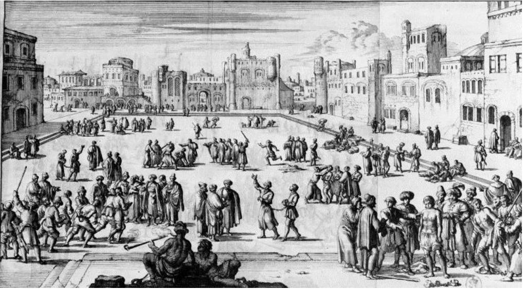
3. ÁBRA ❖ Keresztény rabszolgapiac Algírban. (DAN 1684a. 384. oldalt követően; DAN 1684b)

nem támadhatták meg egymás kereskedőit. Másrészt a szerződésben megengedték a holland hajók átkutatását. Továbbá a holland foglyokat váltságdíj fizetésének fejében szabadon bocsátották. Ezen felül Algírral mindenki szabadon kereskedhetett, és a kereskedelmi termékekre normál adót vetettek ki. A szerződés értelmében azok a holland hajók, melyek idegen lobogó alatt hajóztak lefoglalhatóak voltak. A megállapodás végül szabályozta a mindennapi együttlét kereteit is Algírban. Egyrészt a hollandok és a muszlimok vitás ügyei az algíri díván hatáskörébe tartoztak. Másrészt a holland alattvalók ügyeiben a konzul járt el. 60