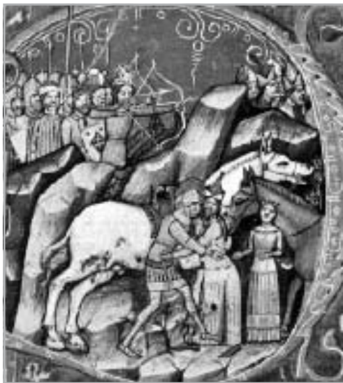
A KERLÉSI CSATA ÁBRÁZOLÁSA A KÉPES KRÓNIKÁBAN

1068-ban nomád sereg tört be a Magyar Királyság területére Moldvából. Az eseményekről csak latin nyelvű magyar források révén van ismeretünk, külhoni történészek nem jegyezték fel a támadást. Azonban a magyar adatok is ellentmondásosak; az egyik változatot a Képes Krónika képviseli, amely a nomádokat cuni néven ismeri, a másik változat Kézai híradása, aki a betörőket bessinek nevezi. A két forma egyúttal két történeti konstrukciót vet fel: a cuni alatt a kutatás úzokat keresett, a bessi viszont értelemszerűen a besenyőkre vonatkoztatható. Kézai forráshelyének egy új értelmezésével magyarázatot adhatunk arra, hogy melyik nomád nép ütközött meg a magyar erőkkel a keleti gyepüknél, Kerlésnél, 1068-ban.