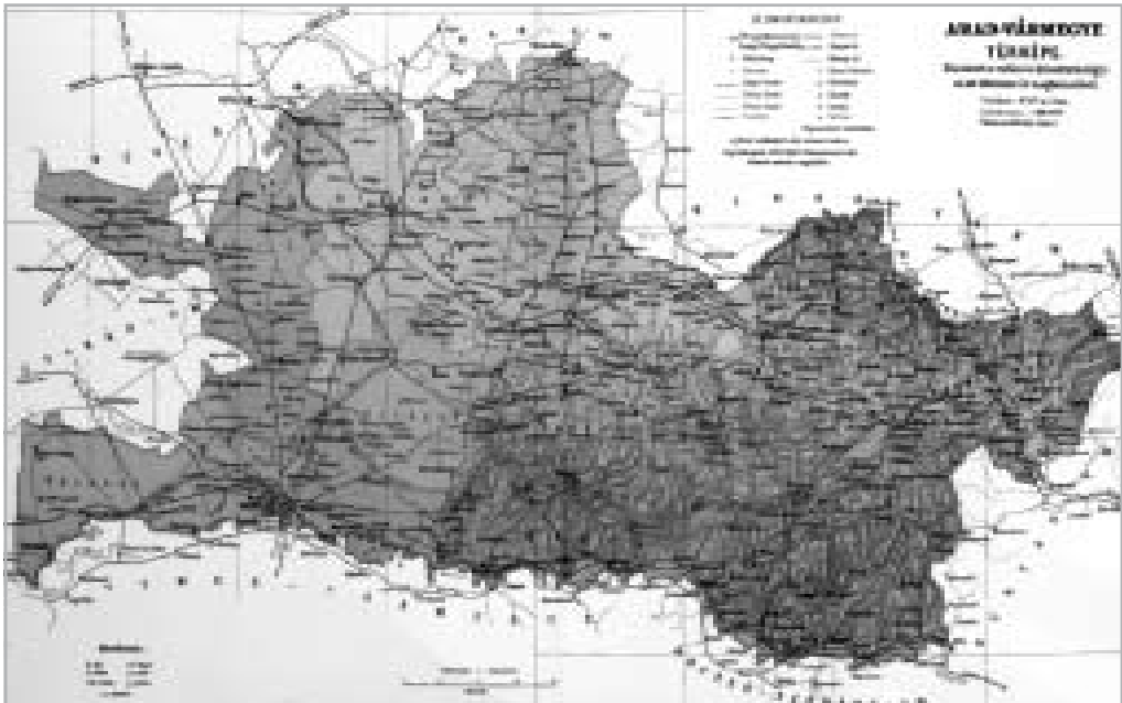
ARAD VÁRMEGYE TÉRKÉPE A KOGUTOVICZ-FÉLE ATLASZBAN