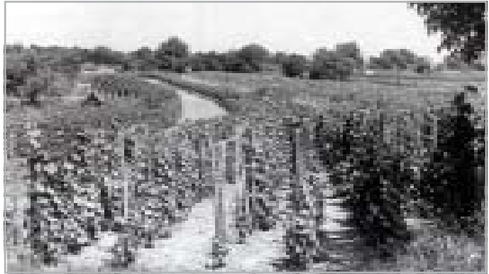
KÉPÜNK CSAK ILLUSZTRÁCIÓ

A szőlőtermesztés mindig nagy fontosságú volt a magyar nép életében. A honfoglalás előtti szavaink azt bizonyítják, hogy a magyarság már a Kárpát-medencébe érkezése előtt rendelkezett szőlészeti-borászati ismeretekkel. Ilyen ótörök eredetű szavaink a szőlő, bor, szűr, seprő, ászok, csiger, homlit, bújt, lyuk, pince stb. 1 Eleink már jól ismerték a ligetes szőlőművelést, de nem kizárt, a magasabb színvonalú termelés sem. 2 A már meglévő gazdag ismereteket csak színezték a XII–XIII. század folyamán betelepült vallonok, a nyugatról érkező németek, majd a XVI. században a török elől menekülő délszlávok, akikhez a balkáni vörösborkultúra jellemzőinek meghonosítása köthető. Az ország területén a középkortól kezdve több jeles borvidéket tartunk számon. Domb- és hegyvidéki borvidékeink a XIV. századtól formálódtak, többnyire irtások eredményeként. Ilyen a Szerémség, Sopron, Eger, Villány Szekszárd, Gyöngyös, 3 vagy a XVI. századtól jelentős Tokaj. 4 A török hódoltság alatt bekövetkezett pusztasodás azonban megszakította ezt a fejlődést. A XVIII. században újraterelített és művelés alá fogott hegyvidéki szőlőinkben az 1800-as évek végén megjelenő filoxéra végzett hatalmas pusztítást. Az első világháború után hazánk szőlőgazdasága teljesen megváltozik.