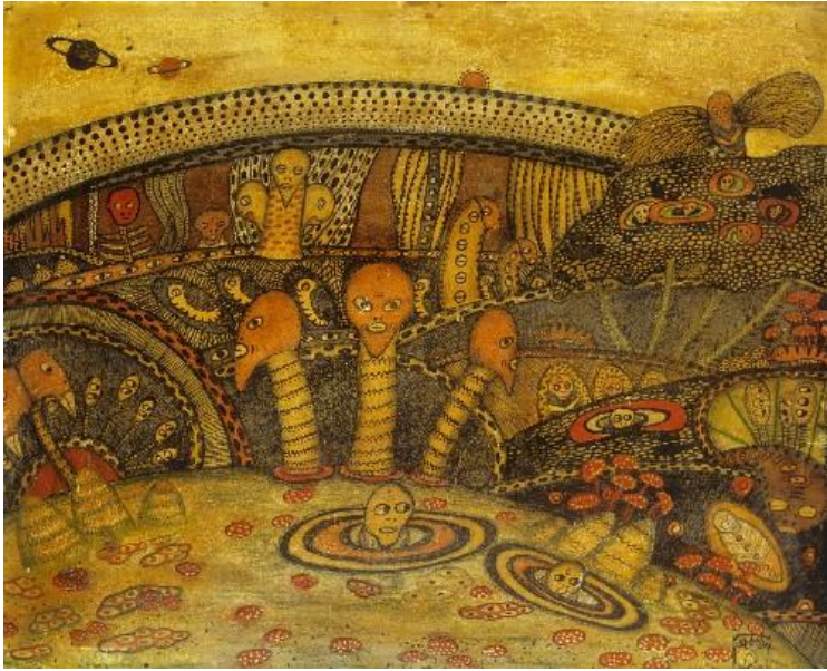
Mokry-Mészáros Dezső: Élet idegen Planétán I. 1910, Magyar Nemzeti Galéria, karton, olaj, 26x32 cm, ltsz: 66.6 T

Nézzünk erre egy példát: Mokry-Mészáros Dezső 10 életművének monografikus feldolgozási kísérlete a művészettörténeti kánon kereteinek szűkösségére mutat rá. Bár a művészi oeuvre értékeit a szűkebb szakma és a gyűjtői kör, a műkereskedelem is elismeri, Mokry-Mészáros műveinek nagy részét a Kecskeméti Naiv Művészetek Múzeuma, mint naiv műalkotást őrzi. Köszönhető ez annak, hogy alkotásaiban, akárcsak a fentebb leírt jelenségekben megmutatkozó anomália, nem csak a téma és formakészlet szintjéig, hanem a dolgok valódi természetéig hatol. A tudományos igényvel megírt spirituális szövegekkel szemben a teozófus művész képein épp ellentétes irányú mozgást figyelhetünk meg: a művészi, ösztönös világba behatoló tudományosság egyfajta homályos („naivnak tűnő”) lebegtetést idéz elő, mely megóvja a műveket attól, hogy a