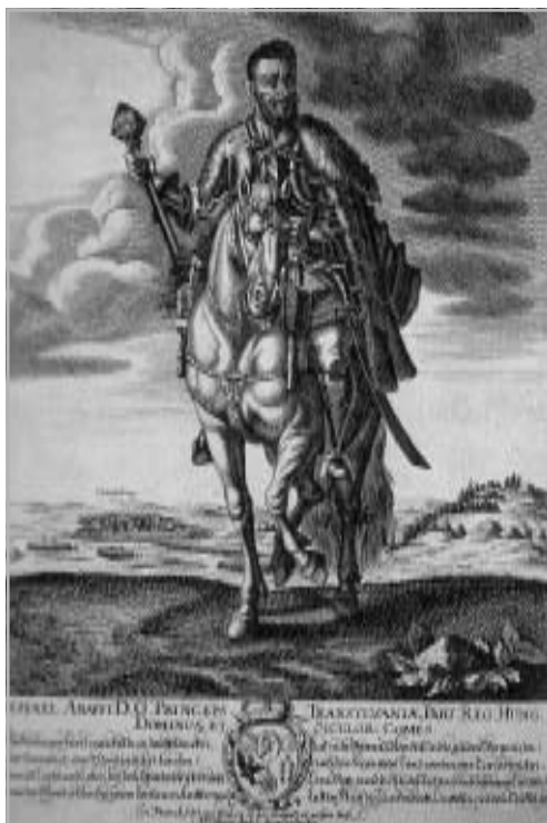
I. APAFI MIHÁLY ERDÉLYI FEJEDELEM (1661-1690)