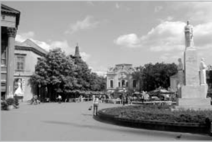
A TÖRTÉNELEMHAMISÍTÁS ÍZLÉSTELEN PÉLDÁJA: A FŐ TÉREN CSERNI JOVÁN „CÁR” SZOBRA

fonon elérni a Szabadkán maradt barátokat, akik megpróbáltak segíteni. Az egyik autó tehát visszaindult a városba, a többiek pedig átlépték a határt. Miközben az ismerős utakat róttuk, sms-ben jött a hír, hogy épp az évszázad Bajnokok Ligája döntőjét szalasztjuk el. Az autó is rakoncátlankodni kezdett, de végül visszaértünk Szabadkára. A határat-