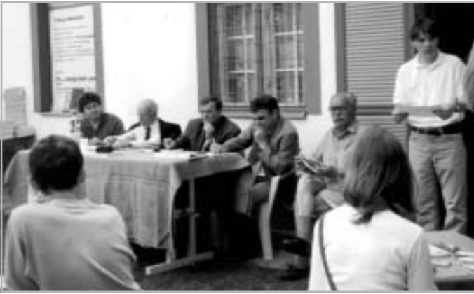
AZ ORSZÁGOS ÁLTALÁNOS ISKOLAI '56-OS EMLÉKVERSENY ZSÚRIJÉBEN

Nagy Imrét és négyszáz forradalmár társát, ezért menekült el kétszázezer magyar szülőföldjéről. Pongrátz Gergely már nem látta meg, nem érte meg itthon azt az áradó erőt, ami a forradalom bukása után még hónapokig működött és hatott, amit csak a legkegyetlenebb eljárásokkal, verésekkel, akasztásokkal, évekig tartó börtönnel, sor-tüzekkel, elbocsátásokkal, évtizedekig tartó féken tartással tudtak megtörni. Gergely már nem élte át a decemberig, majd tavaszig tartó újabb és újabb erődemonstrációkat a forradalmi nemzet részéről és a kegyetlen elnyomás újabb és újabb bilincsszorító akcióit.