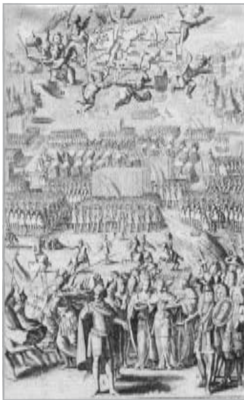
I. APAFI MIHÁLY ÉS LOTHARINGIAI KÁROLY EGY RÖPLAPON

Ahhoz, hogy megérthessük az Erdély beolvasztása körüli vitákat, néhány szót szólnom kell a Habsburg kormányzat működéséről és a külpolitikában elfoglalt helyéről. A Habsburg-hatalom nem volt független a tengeri nagyhatalmaktól, vagyis Nagy-Britanniától és Hollandiától. Hantsch 2 Ausztria történetének összefoglalásában a keleti Habsburg-birodalomnak a korabeli európai szövetségi rendszerekben elfoglalt helyzetéről reális képet nyújtott: Nagy-Britanniának jelentős túlsúlya volt például az 1701-es angol-holland-Habsburg-szövetségben. Ő döntött később háborúról és békéről majd Spanyolországban és a Németalföldön is. Max Braubach 3 a spanyol örökösödési háború folyósított subsidiumokról szóló művében alaposan feltárta a Habsburg-birodalomnak és szövetségeseinek kölcsönét vagy hadfenntartási segélyeit, s ezek jelentőségét. 4 A Habsburg belpolitikáról szólva, az államháztartás már az 1670-es években állandóan deficitese volt. Előbb kormányzati intézkedéseket (például kényszerkölcsönök, fogyasztási adók, stb.) tettek ennek megoldására, amelyek megghiúsultak a rendek ellenállásán. Majd különböző „kalandorjavaslatokra” került sor. 5 De ezek között találunk valódi értékes reformjavaslatokat is. A modern ipari- illetve külkereskedelmi vállalkozások – néhány hosszabb időre életképesnek bizonyuló manufaktúráról